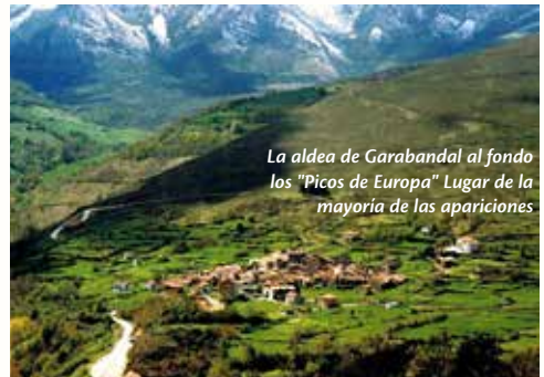
La aldea de Garabandal al fondo los "Picos de Europa" Lugar de la mayoría de las apariciones