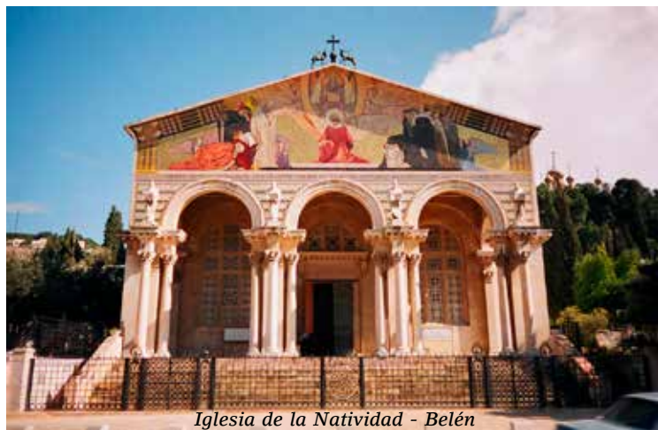
Iglesia de la Natividad - Belén

Gracias a esa devoción, y gracias a las profecías, la pequeña población de Belén siguió ejerciendo una enorme influencia sobre el resto del mundo. Alrededor del año 135 d. C., los romanos construyeron un templo a sus dioses en la misma gruta de la Natividad. Probablemente, como los cristianos tenían verdadero horror a los ídolos paganos, se trataba de un pretexto para detener el continuo